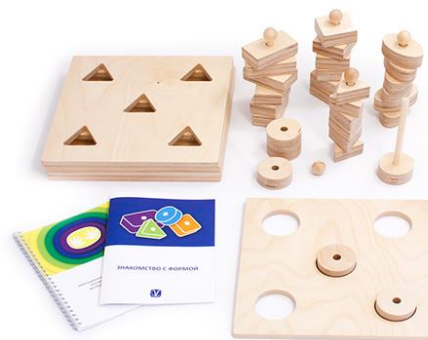
Набор методических материалов «Знакомство с формой»