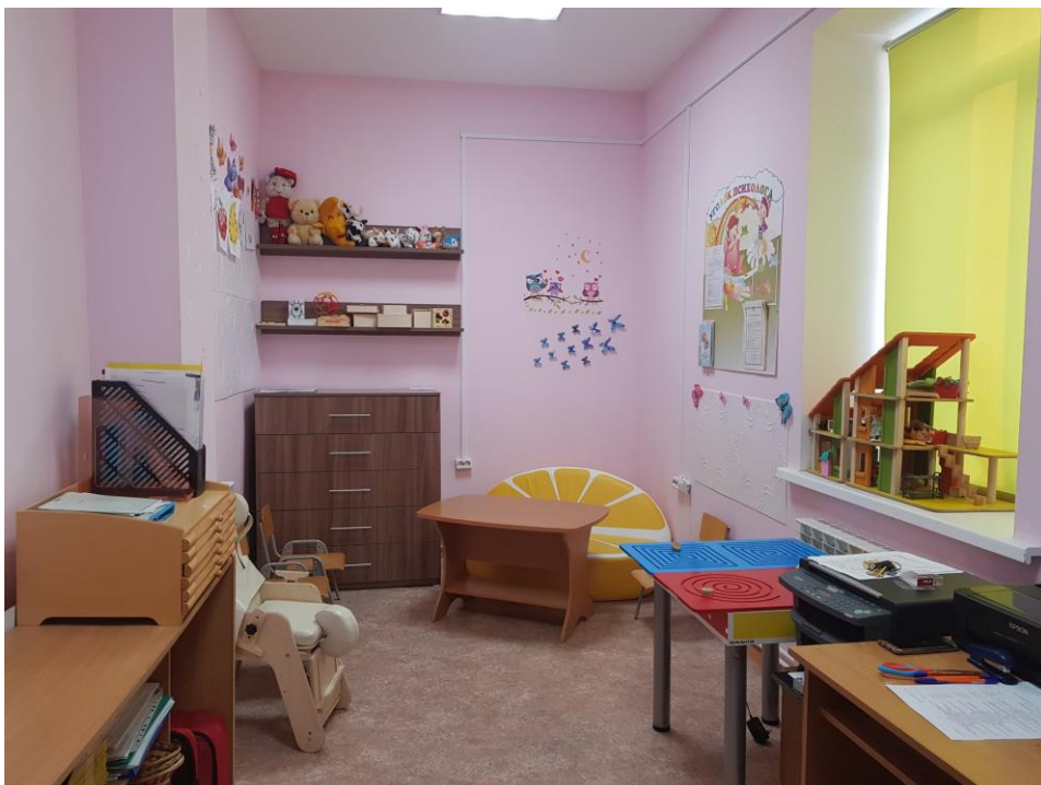
Зона для работы с детьми