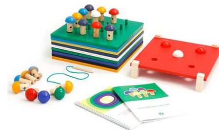
Набор методических материалов «Знакомство с цветом»