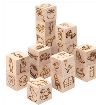
Набор методических материалов «Предметный мир в картинках»