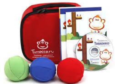
Тимокко - развивающе-коррекционный комплекс с видеобиоуправлением