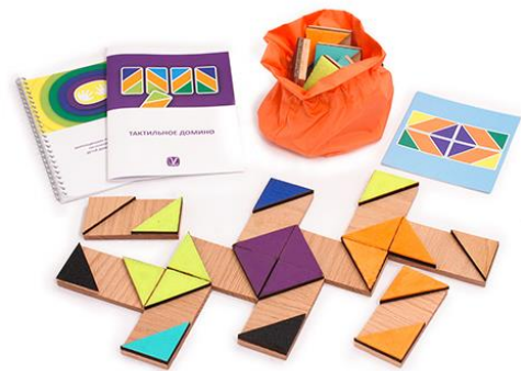
Набор методических материалов «Тактильное домино»