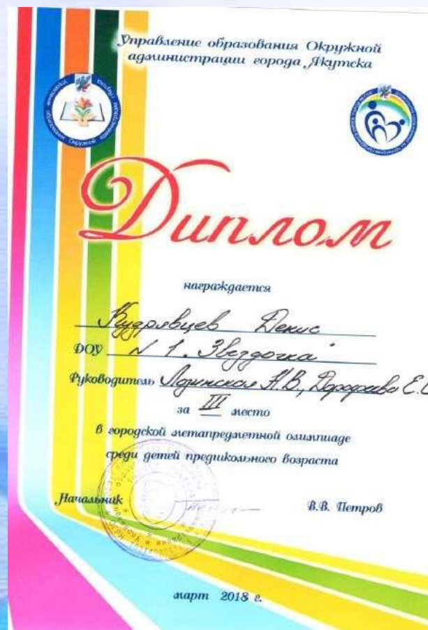
Диплом 3 место