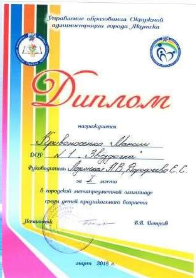
Диплом 1 место