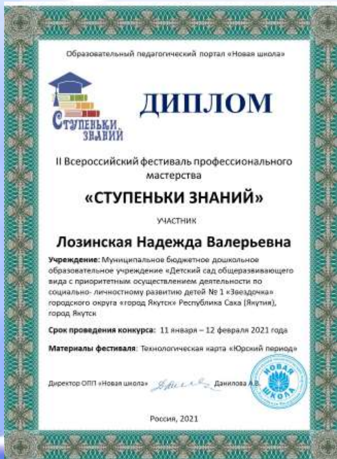
II Всероссийский фестиваль профессионального мастерства «Ступеньки знаний»