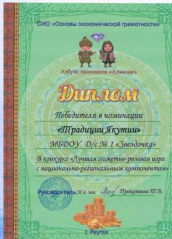
Конкурс «Лучшая сюжетно-ролевая игра с национально-региональным компонентом»