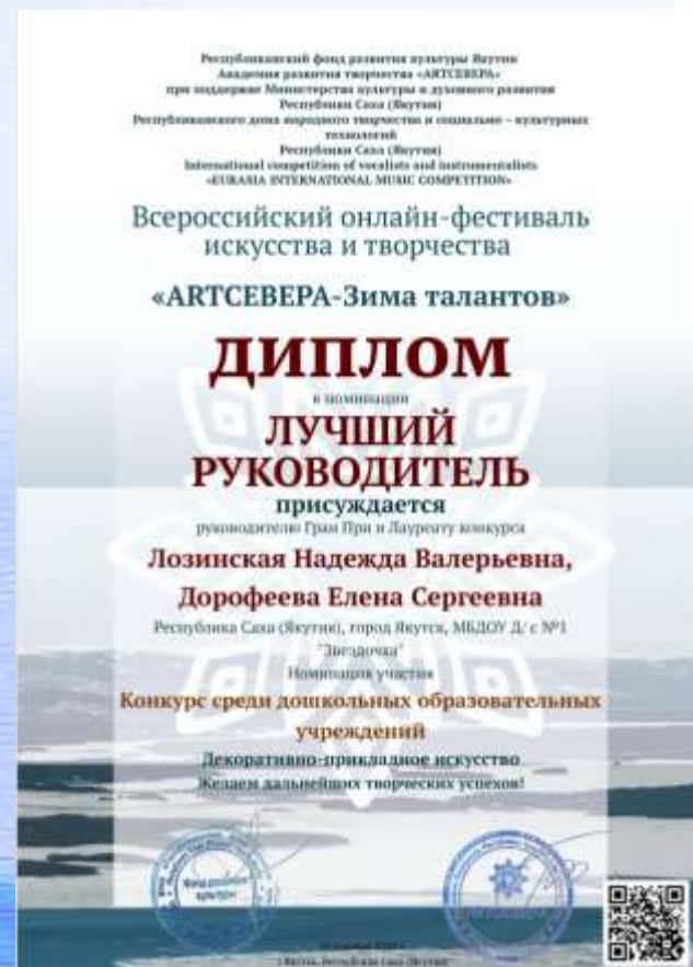
Всероссийский онлайн-фестиваль искусства и творчества «ARTSEBERA - Зима-талантов»