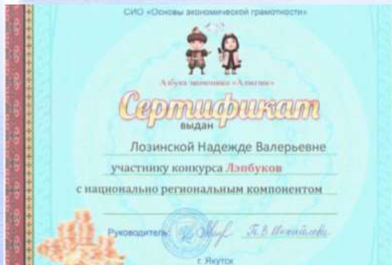
Конкурс Лэпбуков с национально-региональным компонентом по финансовой грамотности